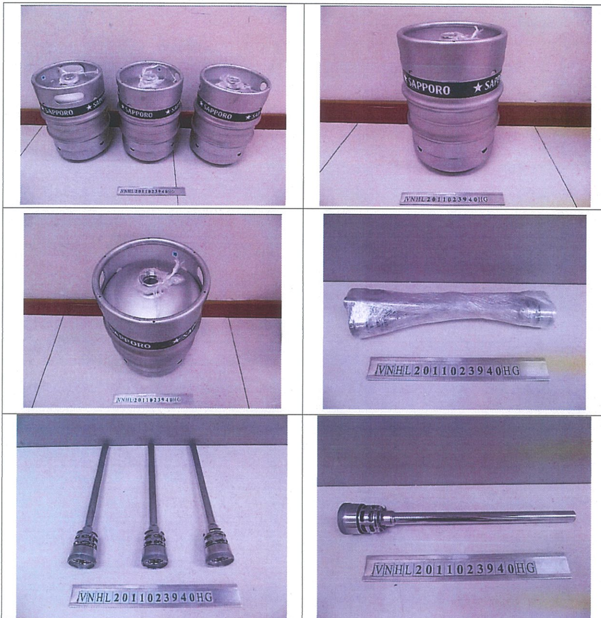
PHOTO OF SUBMITTED SAMPLE FOR TESTING HÌNH SẢN PHẨM ĐƯỢC GỬI ĐẾN ĐỂ THỬ NGHIỆM

REPORT RESULTS REFER TO SUBMITTED SAMPLE (S) ONLY CÁC KẾT QUẢ THỬ NGHIỆM CHỈ THAM KHẢO TRÊN MẪU NHẬN ĐƯỢC